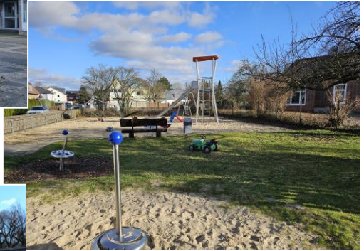
Spielplatz „An den Boldwiesen“ mit der alten Schule