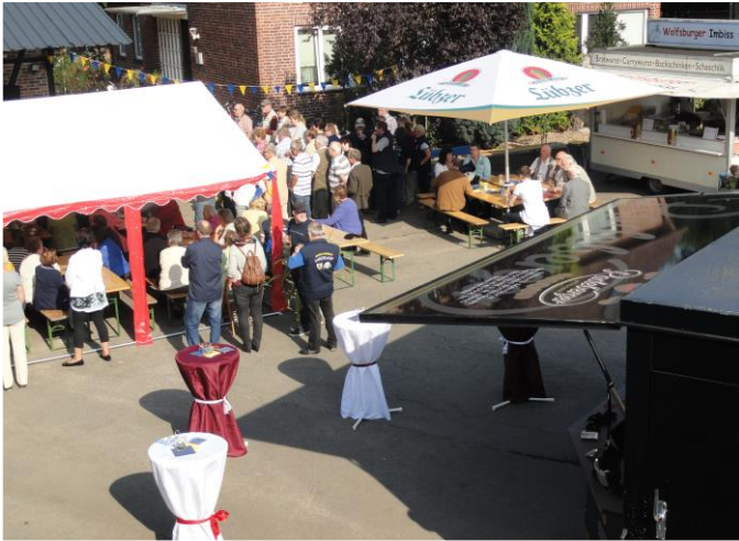
Erntedankfest auf dem Hof von Fam. Schreinecke 2015