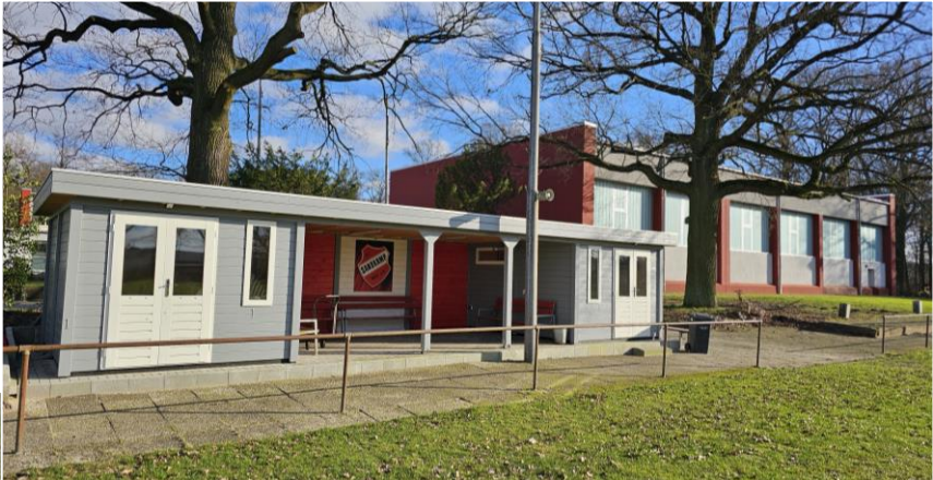
Neuer Unterstand an der Sporthalle