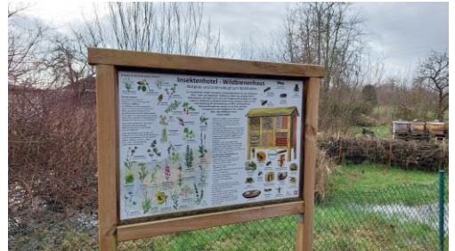
Bienenlehrtafel und Bienenstand