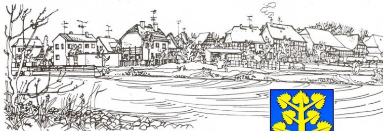
Kulturverein Dorfgemeinschaft Sandkamp e.V.