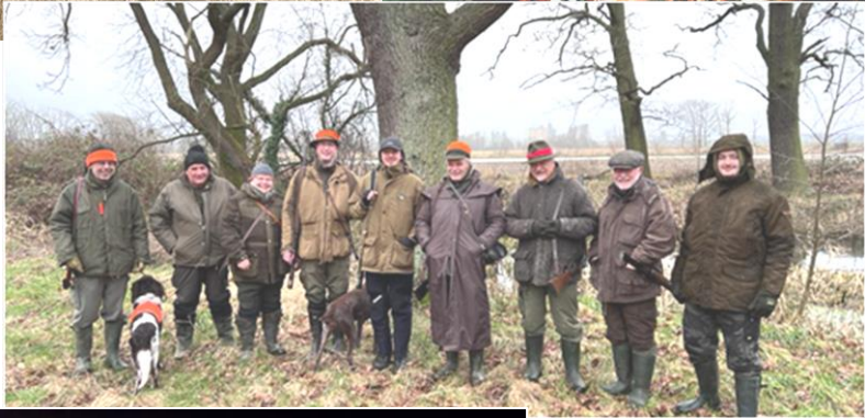
Jagdgemeinschaft früher (oben) und heute