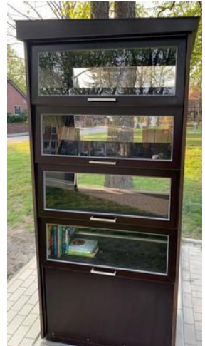
Bücherschrank am Lindenberg