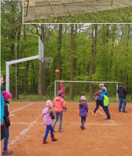
Basketballanlage / Bolzplatz