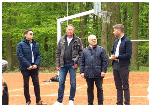
Einweihung der Basketballanlage

Mittlerweile befindet sich auf dem Sportplatz (alter Tennisplatz) eine Basketballanlage mit 2 Körben, sowie eine Outdoor-Tischtennisplatte, die von Sportbegeisterten genutzt werden kann.