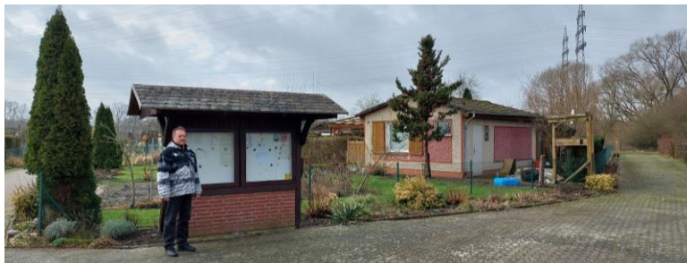
Eingangsbereich und Parzellen der Kleingartenanlage