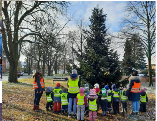
Baumschmücken der KiTa Sandkamp 2023